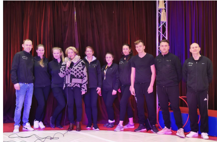
Die Artisten der Familie des Circus Antoni

Viel Spaß und viel Applaus für unsere kleinen Artisten... Manege frei für den Zirkus „Berswordtino 2024“, der Berswordt-Europa-Grundschule/-OGS